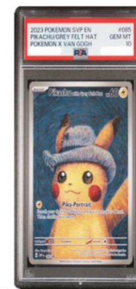
「梵高比卡超 (Pikachu with Grey Felt Hat)」卡牌的設計靈感源自梵高《戴灰色毛氈帽的自畫像》(1887)。