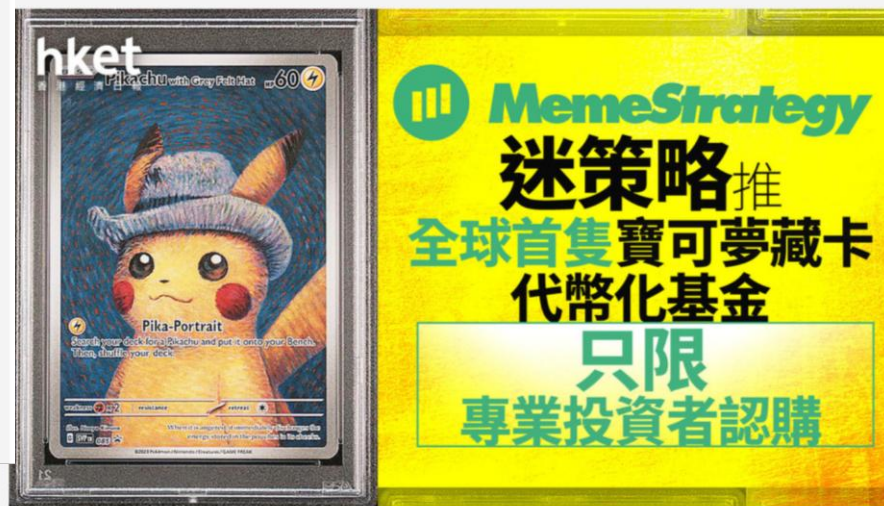
▲ 【另類投資】迷策略推全球首隻寶可夢藏卡代幣化基金 只限專業投資者認購