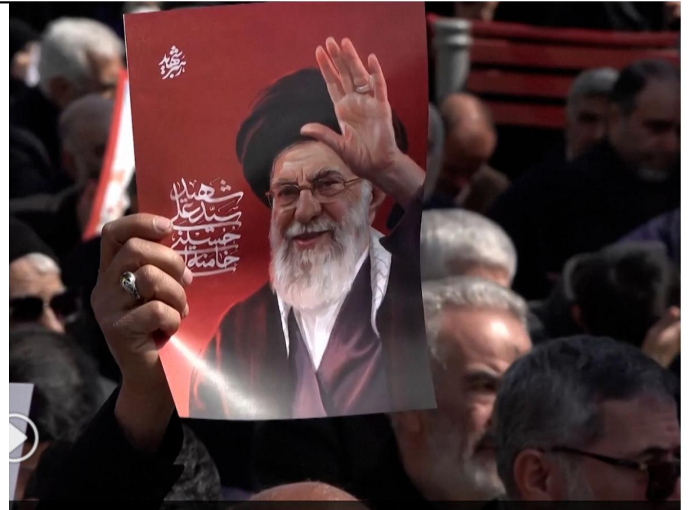
伊朗總統佩澤希齊揚