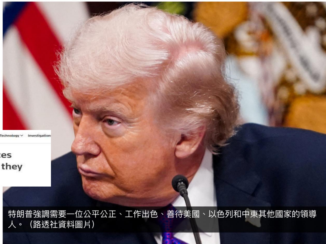
特朗普強調需要一位公平公正、工作出色、善待美國、以色列和中東其他國家的領導人。